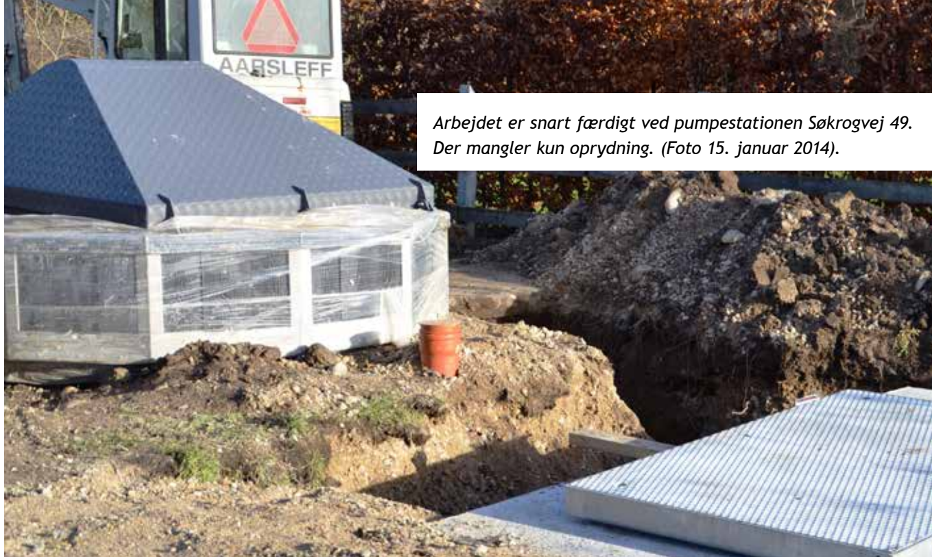
Arbejdet er snart færdigt ved pumpestationen Søkrogvej 49. Der mangler kun oprydning. (Foto 15. januar 2014).